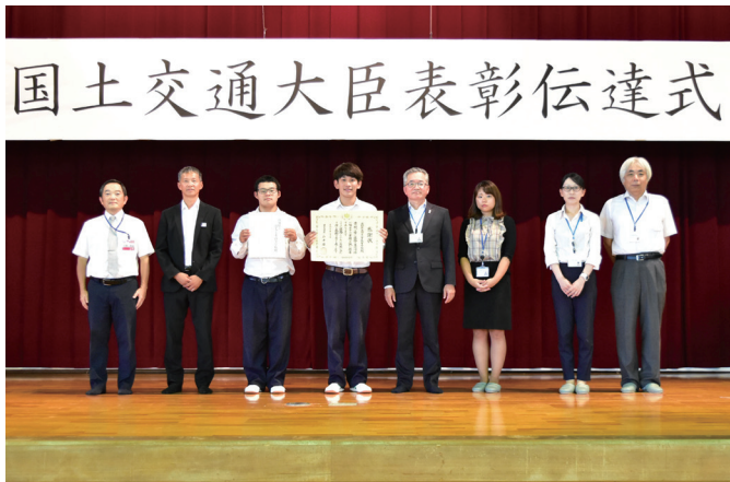
▲高知県立宿毛工業高等学校の皆さん

国道56号およびその周辺地域の環境美化のため、長年にわたり道路清掃等のボランティア活動を実施してきた功績が評価され、「高知県立宿毛工業高等学校」が「国土交通大臣表彰(道路愛護等)」を、「戸内地区を美しくする会」が「四国道路ふれあい協議会長表彰(道路愛護等)」を受賞し、中村河川国道事務所より受賞者代表に感謝状が伝達されました。