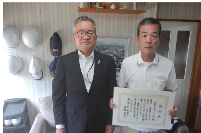
▲戸内地区を美しくする会(写真右・同会会長)

問 国土交通省 四国地方整備局 中村河川国道事務所 ☎ 0880-34-7301