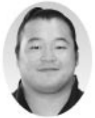
豊ノ島 大樹さん 豊のしま だいき 関取(時津風部屋)