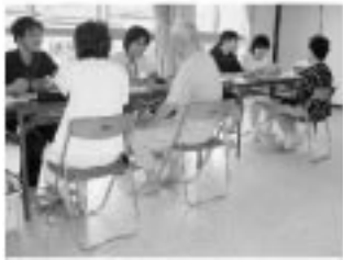
平成18年度は、市内18ヶ所で実施した健診に、1,631人の受診がありました。