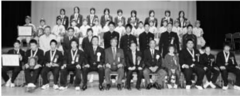
※各学年は受賞当時の学年です

3月号でご紹介しました「平成18年度宿毛市スポーツ賞」の表彰式が、3月5日(月)、宿毛文教センターで行われ、個人優秀賞13名、団体優秀賞3団体が表彰されました。この表彰は、宿毛市の体育・スポーツの普及振興に顕著な功績をあげた個人および団体を表彰するものです。なお、3月号で次の4名の方のご紹介が漏れておりました深くお詫びいたします。