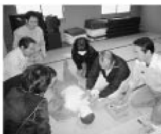
AEDが心電図を解析し、必要のない人には作動しないという安全性も学習しました。

また、設置にあわせて文教センター職員を対象に心肺蘇生法とAED講習会を行い、宿毛消防署員の指導の下、人形を使った人工呼吸、心臓マッサージ、AEDの操作法を体験しました。