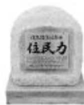
今年5月初旬に 建立した石碑 (縦約70cm・横60cm)

宿毛市、大月町、三原村の25団体で組織する宿毛地区暴力追放推進協議会は、平成18年3月15日に、当時所有権者の倒産に伴い宿毛市内の暴力団が購入しようとしていた、宿毛市中央8丁目の旧暴力団組事務所の土地(約115㎡)