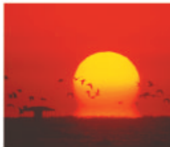
第7回 フォトコンテスト 「宿毛湾だるま夕日」部門 大賞作品 「夕翔」山本 安明