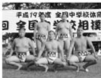
片島中学校相撲部