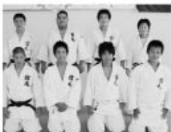
宿毛中学校柔道部