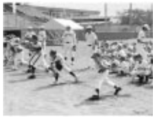
早稲田大学野球部前監督と現役野球部員から指導を受ける少年野球チームの子どもたち

今後も教育文化スポーツ関係の催し物に際しての講師等については早稲田を念頭においた進め方をして行こう、また、学生の修学・研修等の旅行に宿毛を活用してもらったり、例えば大学食堂にハネのオクラやブロッコリー等や浜値の魚を直販する等の食材を通じた交流も図って折角の縁を大切に活用させていただきたいと思っています。