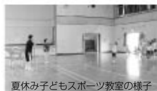
夏休み子どもスポーツ教室の様子