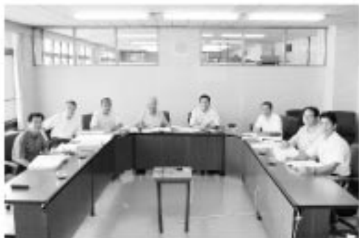
決算特別委員会 委員