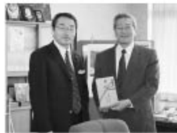
11月1日、四国電力(株)中村支店長から市長に目録が手渡されました。