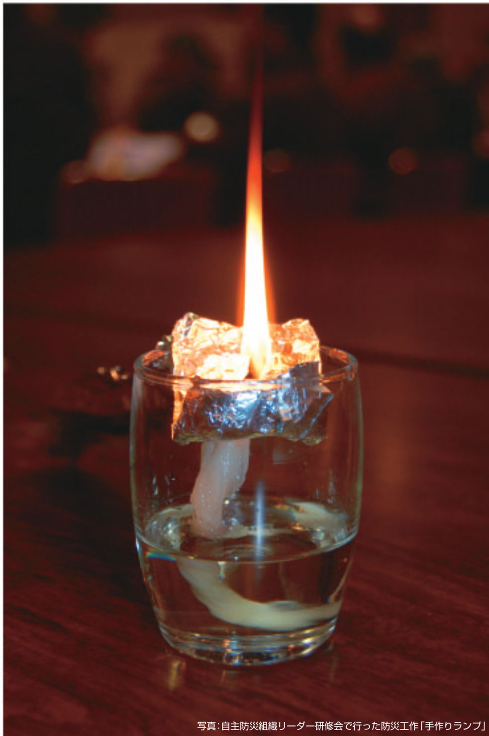
写真：自主防災組織リーダー研修会でいった防災工作「手作りランプ」