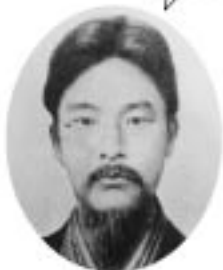
早稲田大学建学の母 小野 梓