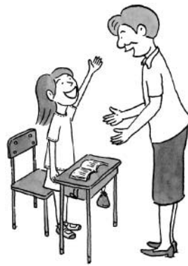
人の話を目で聞ける子

ちの安全面等、諸条件を考慮して進めていかなければならないと考えております。近年の少子化傾向により児童生徒の減少が進み、小規模化が深刻化してきました。次代を担う子どもたちが心豊かに、生きる力を育みながら成長するためには、まず良好な教育環境を整え、教育の充実を図ることが必要であると考えます。