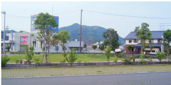
集合保留地周辺写真