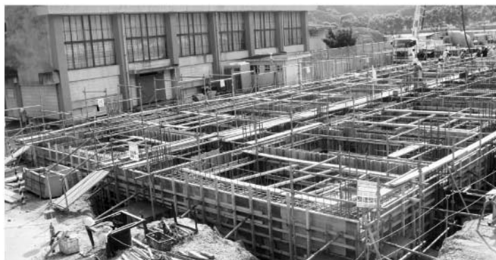
建築中の小筑紫小学校

また、工事請負契約議案は、小筑紫地区小学校統合校舎改築工事について、請負契約を締結しようとするものです。慎重な審査の結果、いずれも、原案のとおり可決しました。