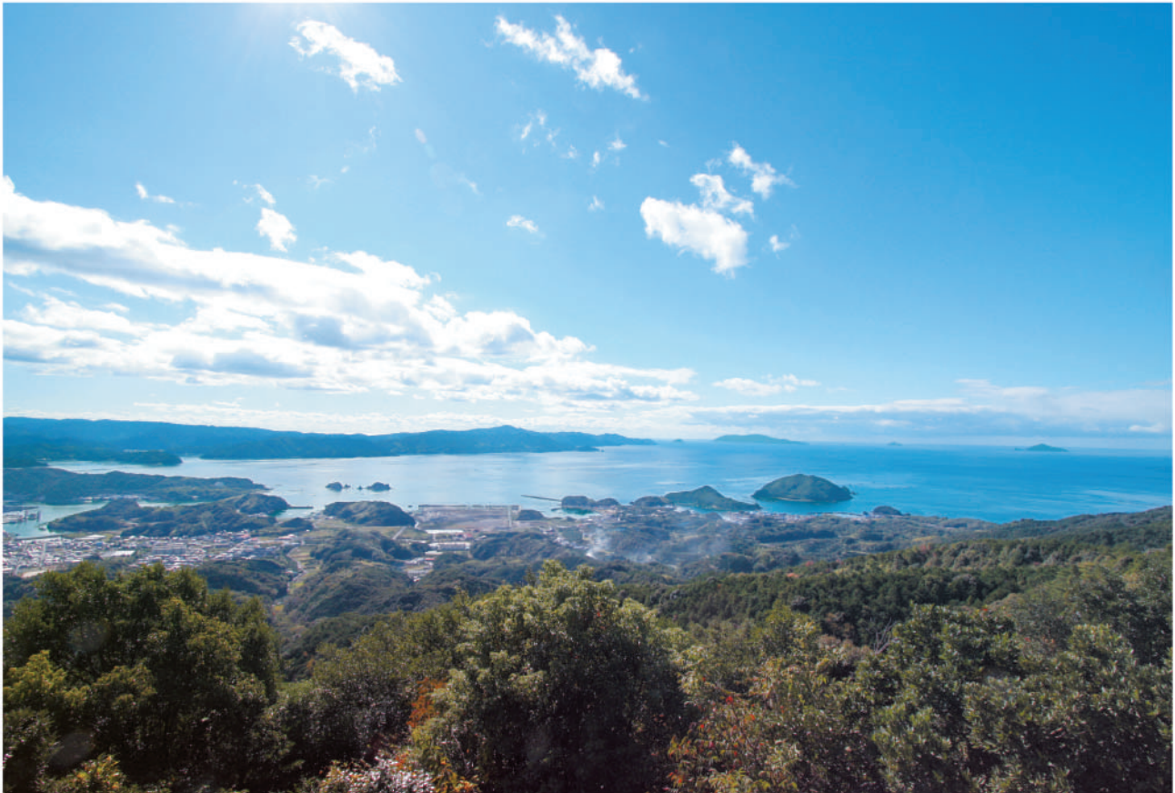
純友城址展望台からの眺め