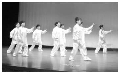
宿毛市太極拳クラブ

中央公民館では、みなさんのふれあいや仲間づくりのきっかけとなるサークル等の学習活動を支援しています。