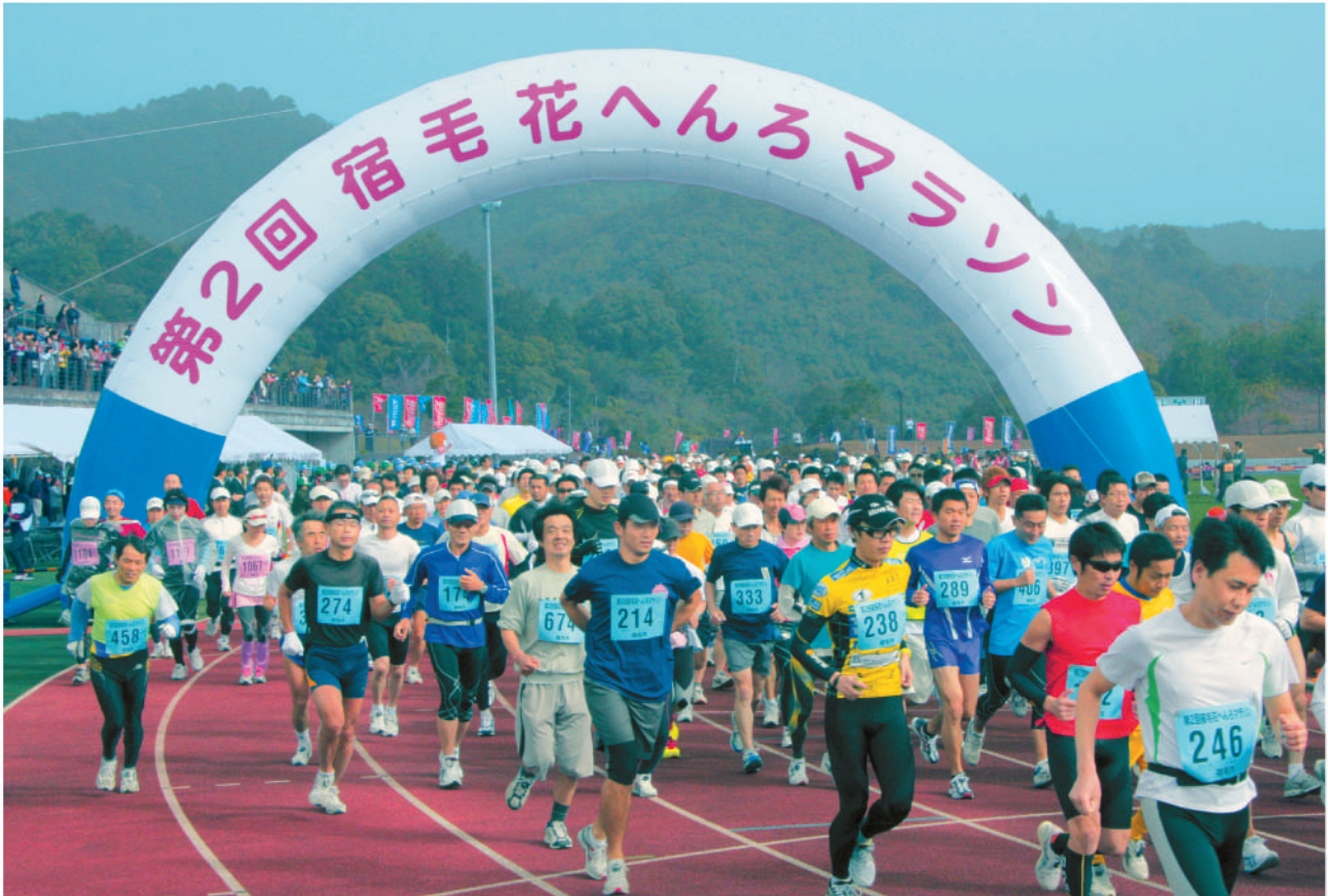
フルマラソンスタート