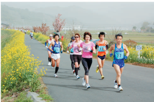
松田川沿いの堤防

3月21日(日)に、総勢1,010名のランナーが参加し、開催されました。詳しくは、広報すくも5月号で報告します。