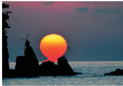
金賞「紅い夕日」浦田 耕作