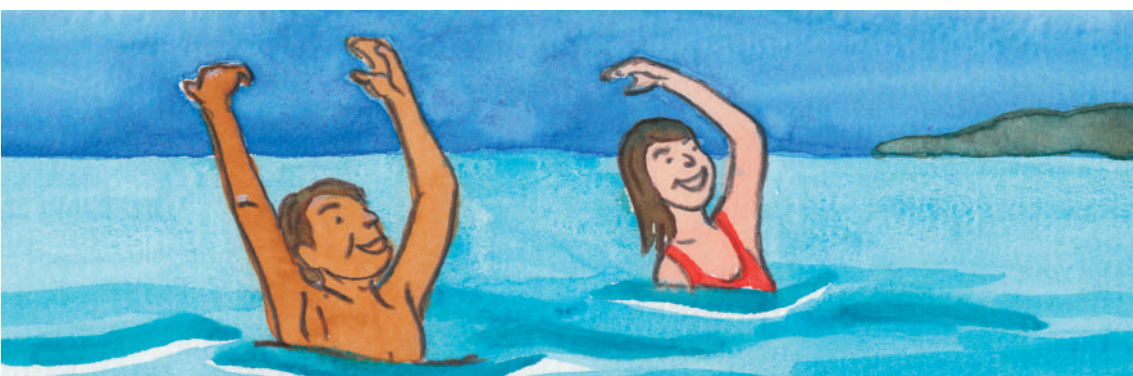
イラスト:おくだたけし