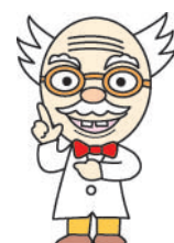
トラフ博士 ©やなせたかし

平成7年の阪神淡路大震災では、 死亡原因の8割以上 が建物の崩壊や家具等の転倒による圧死・窒息死であったとされています。特に建物の崩壊による被害は 昭和56年5月31日以前の旧建築基準で建てられた木造住宅 に多くみられました。