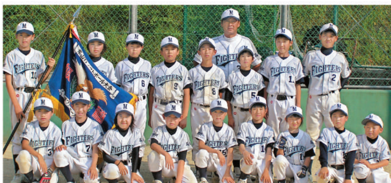
写真 咸陽・松田川SC

発行/宿毛市 編集/企画課 画631-1118 販631-0174 平成22年7月1日発行(毎月1日発行)