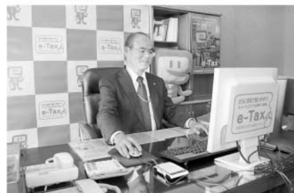
デモ申告を体験する沖本市長

インターネットを利用して、所得税の確定申告ができる「e-Tax」（国税電子申告・納税システム）の利用促進を図るため、沖本市長が同システムを利用し、デモ申告を体験しました。