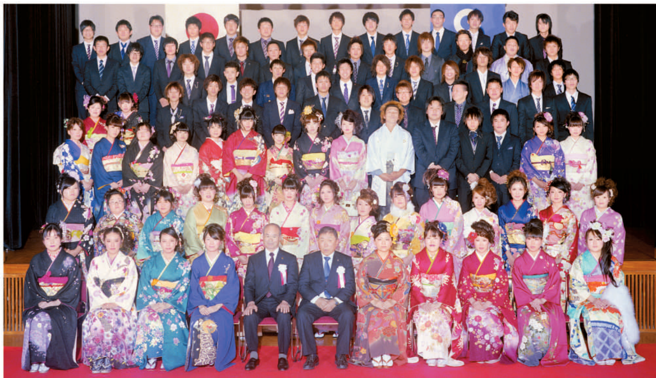
写真：平成24年成人式 (関連記事7ページ)