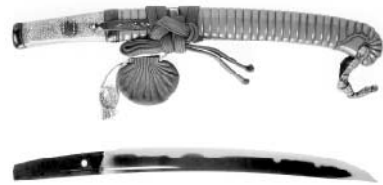
(当館蔵 45cm 刃渡り28cm)