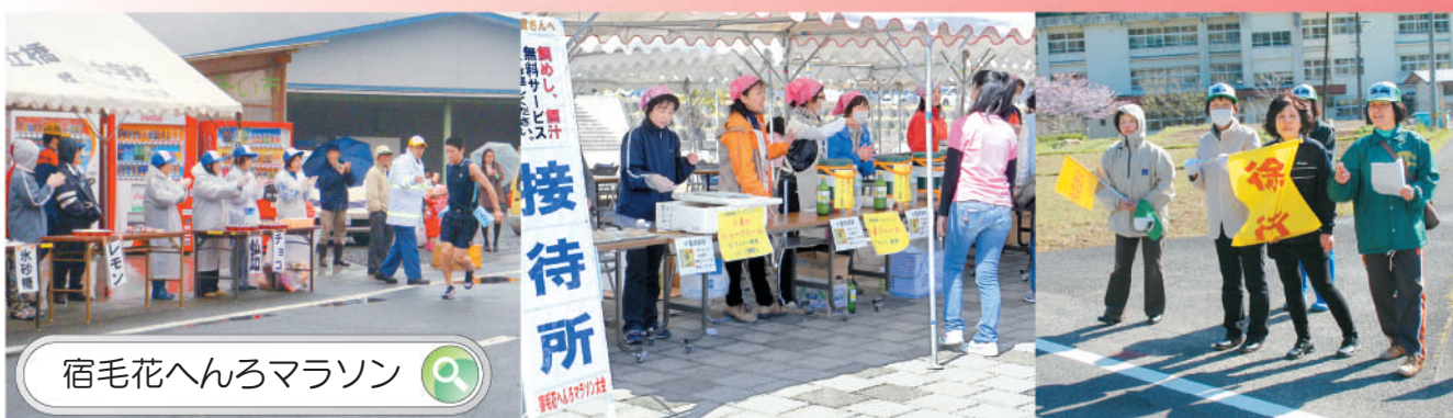
宿毛花へんろマラソン