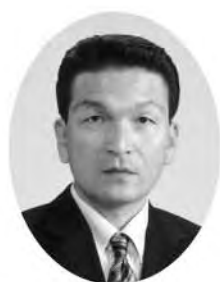
浦尻 和伸 議員