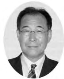
山上 庄一 議員