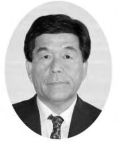
宮本 有二 議員