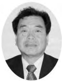
浅木 敏 議員