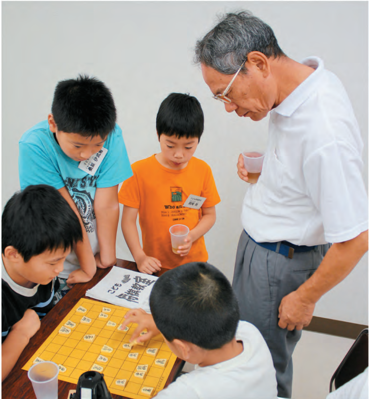
3日間あった子ども将棋教室の最終日です。トーナメント戦で優勝を目指して熱戦が繰り広げられました。次の一手を考え、真剣に打ち込んでいました。