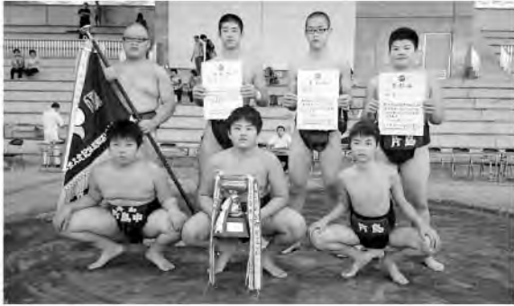
片島中学校相撲部