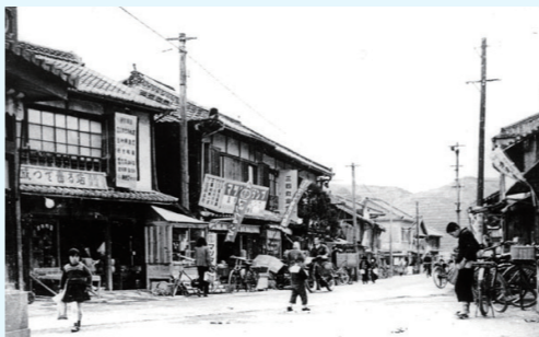
昭和30年 片島商店街