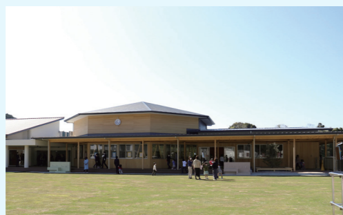
きぼうが丘保育園