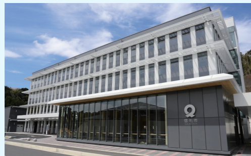
宿毛市役所新庁舎

R4/R3/R2/H31/H30/H29/H27/H26/H25/H24/H23/H22/H21/H18/H17/H16/H14/H13/H11/H10/H9/H6/H5/H2/H1/S61/S58/S57/S56/S54/S52/S50/S49/S46/S44/S43/S42/S40/S39/S38/S36/S35/S32/S29