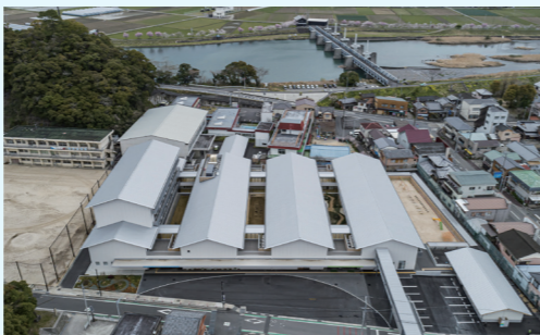
宿毛小学校および宿毛中学校新校舎