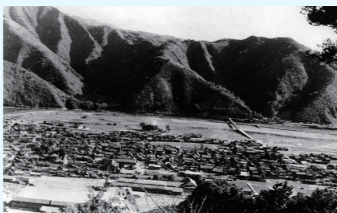
昭和28年 宿毛市街地