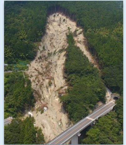
大豊町で発生した山腹崩壊 (平成30年7月撮影)