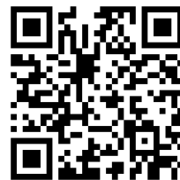
お申し込みQRコード