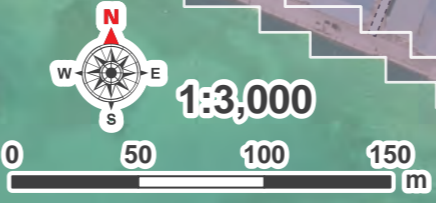
この背景図は平成26年1月撮影のものです。