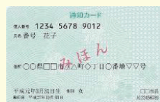
通知カード 利用できません