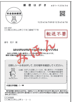
個人番号カード交付通知書