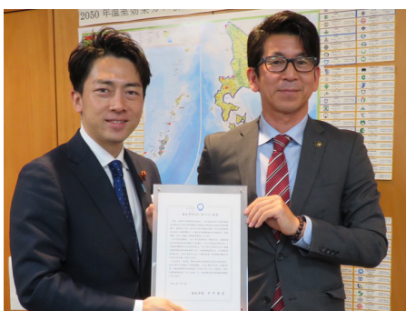
宿毛市 2040 ゼロカーボンシティ宣言

市民並びに議員の皆様方におかれましては、より一層のご理解とご協力をいただきますようお願い申し上げます。