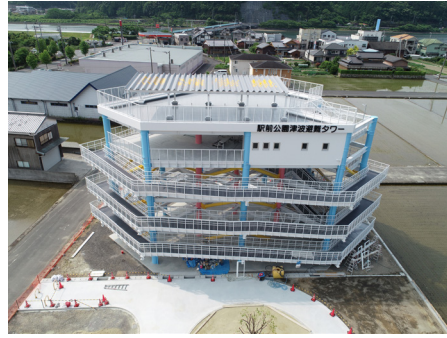
駅前公園津波避難タワー

近年、温暖化の影響により、全国各地で甚大な被害をもたらす災害が発生しています。災害から命を守るためには、平時から市民一人ひとりの備えが重要となることから、各種ハザードマップのさらなる周知や防災アプリの推進、各地区への防災学習の普及、防災意識の啓発に努めて参ります。