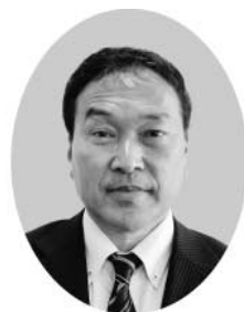
堀 景 議員