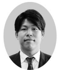
小谷 翔太 議員

答 外出の状況調査では、ほとんど外出しない・週一回外出との回答が22・8%、年齢区分で85才以上では50%となっている。健康診査の実施や結果を基に生活習慣の中に栄養、口腔、運動習慣を取り入れるよう、情報提供や啓発を行っている。