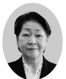
高倉 真弓 議員

オンライン授業を希望する場合、1人1台の端末を使用し、オンラインで通常の授業や、学習が家庭や別室等で受けることができ、学習保障において、非常に重要な役割を果たしており、現在、希望があった5名の児童生徒がオンライン授業を活用している。集団授業に抵抗がある児童生徒にとって、心理的に安心できる環境で学ぶことができ、学習の保障と合わせて効果的な取り組みとなっており、オンライン授業等を活用した5名の生徒については、全員出席扱いとなっている。