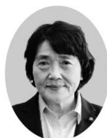
川田 栄子 議員